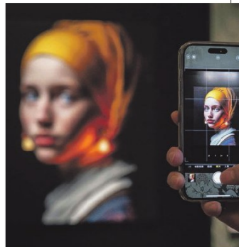
AI's Meisje met de parel in het Mauritshuis.

De resterende 10 procent (laten we daar nog maar even van uitgaan) zal worden weggedrukt door synthetisch materiaal, iets waarvan Google nu een voorproefje geeft. Het web zal worden overspoeld met kunstmatig geproduceerd materiaal dat in toenemende mate geënt zal zijn op andere synthetische teksten en plaatjes. En de arme consumptie wordt via een bombardement van op maat gemaakte illusies gevangen in een spektakelmaatschappij van totale bevrediging. Hiermee krijgt de hyperrealiteit van de Franse postmoderne filosoof Jean Baudrillard vijftig jaar na dato zijn definitieve gestalte. In deze hyperrealiteitervaagt het onderscheid tussen de werkelijkheid en de representatie ervan, en krijgen simulacra (kopieën of simulaties) van de werkelijkheid de overhand. Een voorbeeld dat Baudrillard aanhaalt, is Disneyland. Het is een geconstrueerde wereld die zo perfect is in zijn simulatie dat het de werkelijkheid overtreft. Mensen bezoeken Disneyland en ervaren de betovering en opwindende van de fantasiewereld, maar vergeten daarbij dat het slechts een gecreëerde illusie is. Disneyland is nog niets vergeleken bij AI.