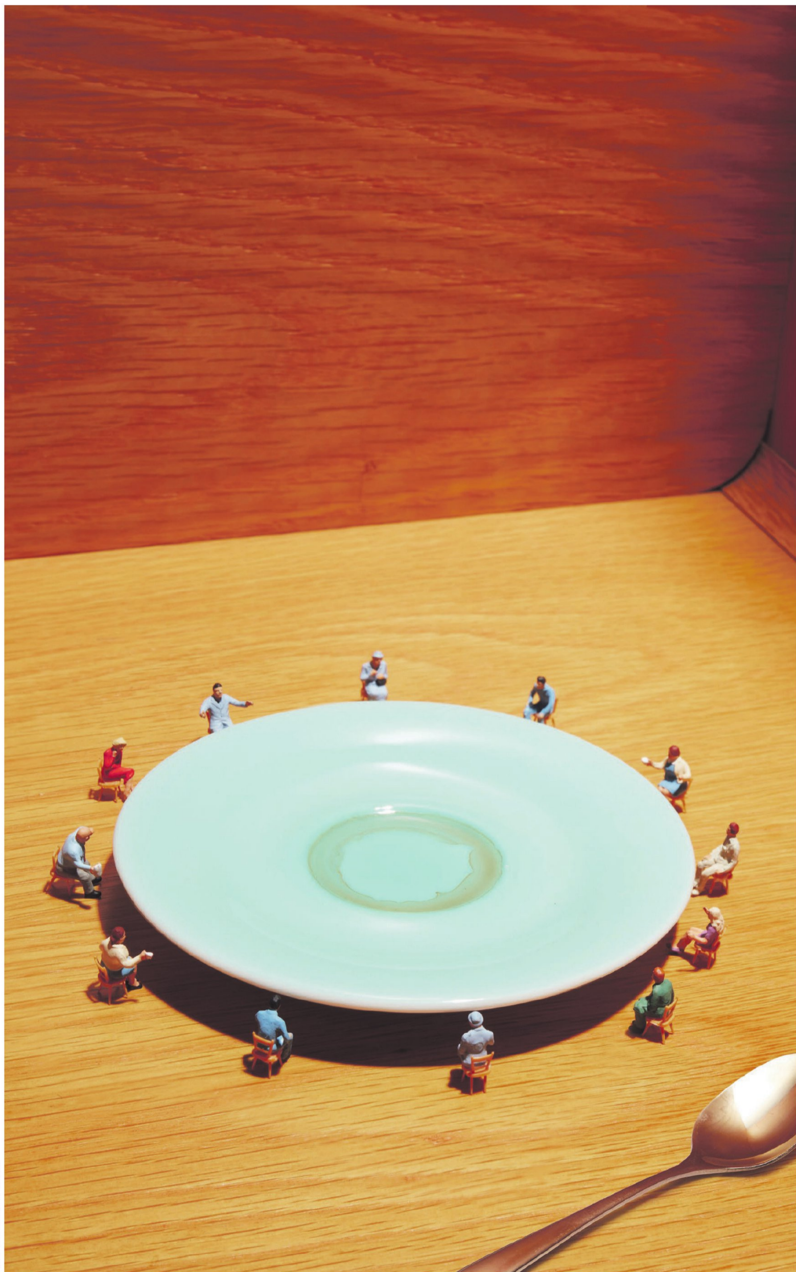
Beeld Van Santen & Bolleurs